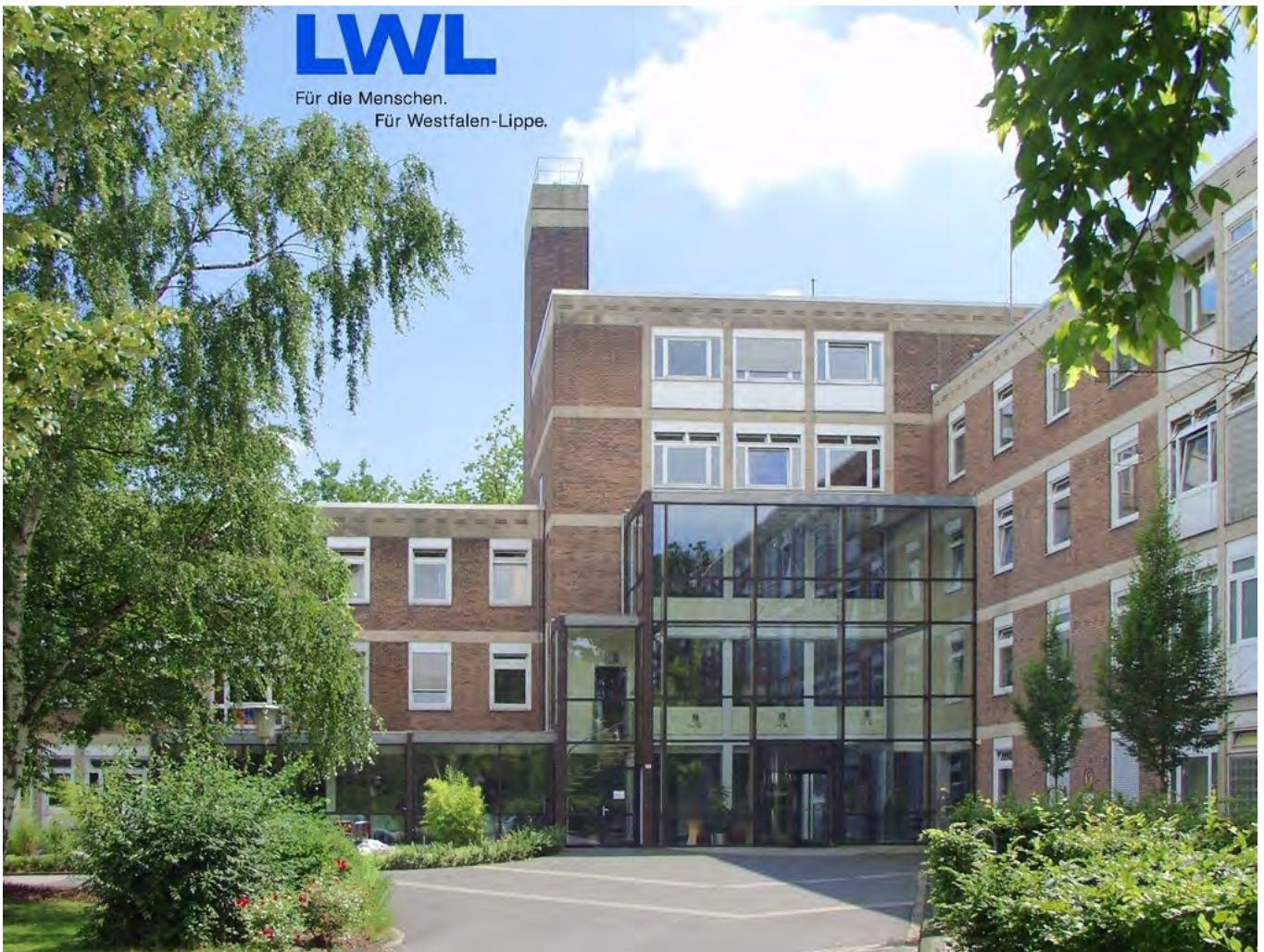
Abbildung: Eingang der LWL-Klinik Hamm Kinder- und Jugendpsychiatrie Psychotherapie Psychosomatik

Die LWL Klinik Hamm ist traditionell eine Klinik mit deutlicher psycho- und familientherapeutischer Ausrichtung. Als eine der größten Einrichtungen für Kinder- und Jugendpsychiatrie und -psychotherapie in Deutschland halten wir breit gefächerte Therapieangebote vor. In Hamm erwartet sie hohe Fachlichkeit mit Innovationskraft. Unsere Klinik ist unter anderem Ausgangspunkt für Psychomotorik in Deutschland. Auch die jugendpsychiatrische Suchtbehandlung ist eines unserer seit langen Jahren bestehenden Spezialangebote. Darüberhinaus stellt die Früherkennung und innovative Behandlung schwerwiegender kinder- und jugendpsychiatrischer Erkrankungen einen Schwerpunkt unserer Expertise dar. Diese und sämtliche andere Angebote sind ganz auf die Bedürfnisse und Themen unserer Patienten ausgerichtet. Die Zufriedenheit unserer Patienten mit dem Ablauf und den Ergebnissen unserer Behandlung ist für uns richtungsweisender Maßstab auf dem Weg zu immer weiteren Verbesserungen.